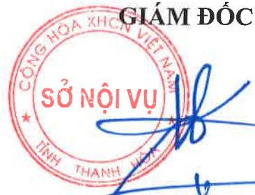
Nguyễn Xuân Thủy